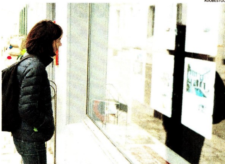
Mutui per i giovani. Facilitato l'accesso ai mutui prima casa per gli under36