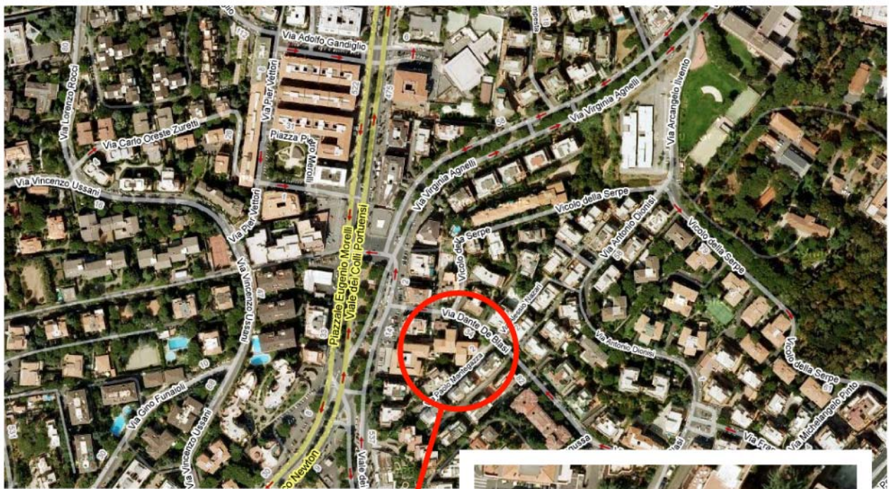
Ubicazione complesso Immobiliare in Roma Via Dante De Blasi, 36

Il quartiere dista dal centro della città pochi chilometri, circa sei, e dal punto di vista dei collegamenti urbani lo si può ritenere discretamente servito, data la presenza di numerose linee di servizio pubblico. Sono presenti, inoltre, tutti i servizi pubblici essenziali, quali scuole, asili d'infanzia, banche, supermercati, mercato rionale ed ospedali.